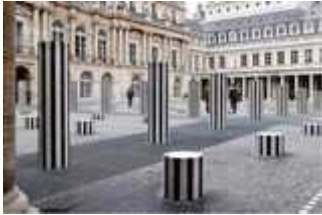
Image des colonnes burènes (de simples piliers avec des bandes noires et blanches verticales)