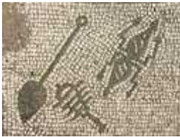
Image d'une mosaïque avec la pelle, le briquet (pour allumer la torche) et le foudre

C'est là que ça devient très instructif pour nous : le Lion est aussi un grade initiatique : ses attributs sont la pelle à feu, la mèche (ou le "briquet à amadou") et le Foudre de JUPITER. Et voilà notre Monarc démasqué. La pelle attise le feu de la Révolte, grâce à l'injustice et l'autoritarisme de Jupiter. Il suffit donc d'allumer le brasier avec le briquet (qui n'est pas un sistre [instrument de musique qui fait du bruit quand on le secoue]) pour terminer la cuisson de la vache à lait nationale (Lion grade 4). C'est tout le but de l'agenda de Marie-Anne avec son bonnet Phrygien depuis 1789, sacrifier le taureau France.