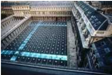
Image de La place des colonnes burènes la nuit, l'éclairage rends un tout autre motif.