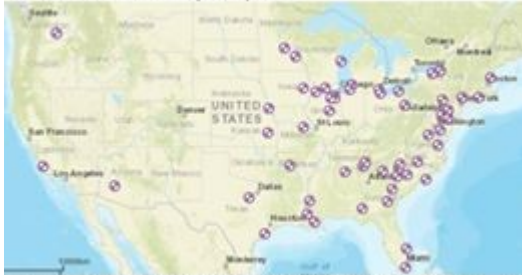
Locations of U.S. nuclear power plants