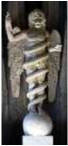
Figure 2: Léontocé phale

[AM : Le lion de Belfort , sculpture majeure de Bartholdi après la statue de la liberté, est aussi appelé Lion de Belfort. Sculpté en 1875 dans la falaise de grès rouge, en face de Belfort. Sculpture monumentale de 11 m de haut pour 22 m de long. Il préfigure le symbole repris par les Peugeot par la suite.]