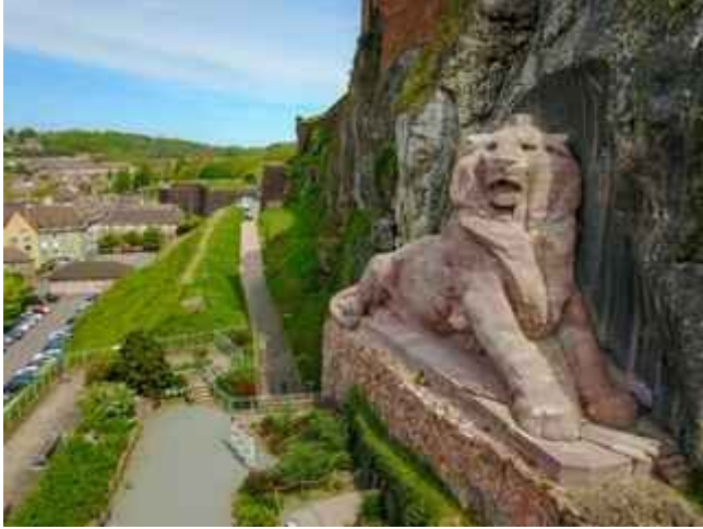
Figure 3: Lion Bartholdi de Belfort

Le Lion Rouge de Bartholdi est en fait un sphinx : il suffit d'observer la crinière du Lion. Les mythriaques qui ont inspirés les constructeurs républicains vouent aussi un culte au Léontocéphale, un homme à tête de Lion entouré d'un Serpent. Il est le précurseur et non la finalité :