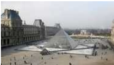
image Pyramide de verre du Louvres