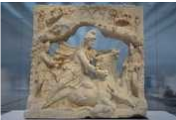
Image bas relief de Mythra égorgeant le taureau