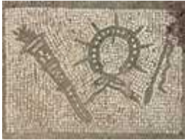
Image d'une mosaïque d'un Mithraeum avec la torche, la couronne de pointes solaires/d'épines, et le fouet

C'est encore plus évident quand on voit les attribut du grade initiatique de l'Héliodromus, ou certaines sculptures le représentant : Vous voyez un Livre avec les Lois ou un fouet ? La statue de Bartholdi brandit certes une torche mais pas un fouet. Ça veut dire que c'est la Loi qui mène le monde par le fouet. C'est donc grâce à la Loi que l'Heliodrome conduit le Taureau-nation, et que ce sont les institutions républicaines qui feront le sale boulot d'égorgement. Quant au flambeau qui éclaire le Monde, ce sont les élites qui le tiennent. Ce sont elles qui dictent le chemin à suivre comme à Davos, tel un phare, et la loi est leur outil de coercition.